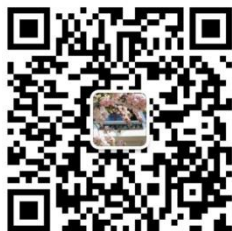
“外国语学院教务办”微信二维码

请取得复试资格的考生提前安装微信应用，并于 9 月 18 日中午 12:00 前用微信扫描下方二维码，将“外国语学院教务办”加为好友。加好友时须发送申请信息： 报考的专业名称（亚非语言文学专业还需有方向名称）+姓名+身份证号码后四位 ，方可通过验证。逾期不加好友的，将视为放弃复试。