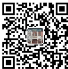
“北京大学外国语学院” 微信二维码

3. 请通过手机终端“微信 app”扫描下方二维码，将“北京大学外国语学院”加为微信好友。加好友时须发送： 专业+姓名+准考证号 ，方可通过验证。